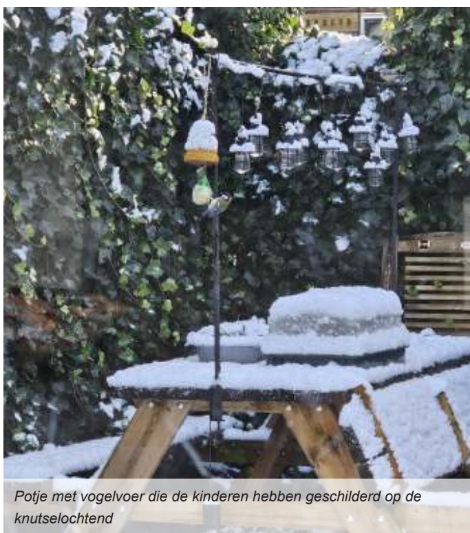
Potje met vogelvoer die de kinderen hebben geschilderd op de knutselochtend