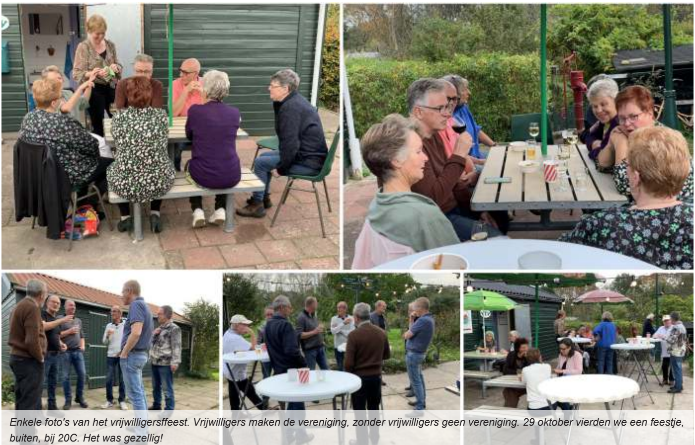
Enkele foto's van het vrijwilligersfeest. Vrijwilligers maken de vereniging, zonder vrijwilligers geen vereniging. 29 oktober vierden we een feestje, buiten, bij 20C. Het was gezellig!